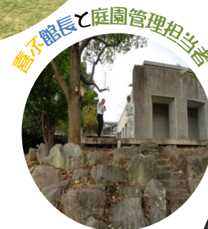
富士館長と庭園管理担当者

ピクニック原っぱの近くにある「オリエンテーション広場」の木の伐採と笹を刈り見通しがとても良くなりました。